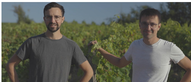
Domaine des Frères - Loire - Deuxième Prix