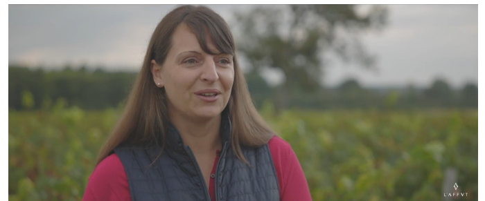
L'Affût - Loire - Troisième Prix