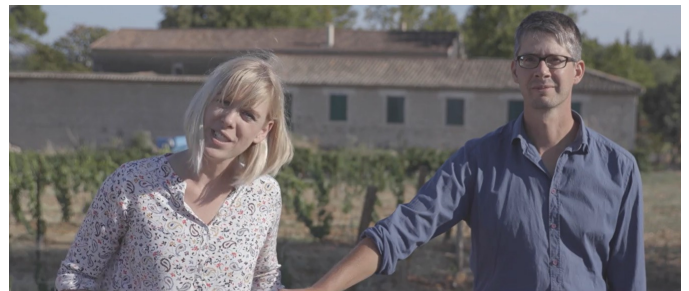
Domaine Ampelhus - Languedoc - Premier Prix

https://www.youtube.com/c/AdViniDiffusion