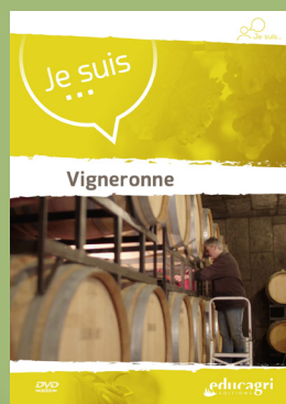
Je suis... Vigneronne 15 € / 2022 / DVD 10 min Réf ME02108 (ou 5 € en VOD)

Ces ressources peuvent aussi vous intéresser