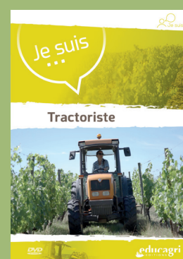
Je suis... Tractoriste 15 € / 2023 / DVD 15 min Réf P22VID009 (ou 5 € en VOD)